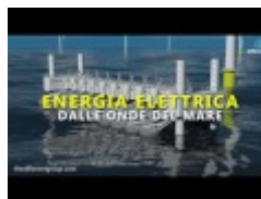
centrale WaveStar in Danimarca

Uno delle opere più importanti di "Land art" è l'installazione "Floating Piers" di Christo, che dal 18 Giugno al 3 Luglio 2016 ha visto accorrere migliaia di turisti sul Lago d'Iseo.